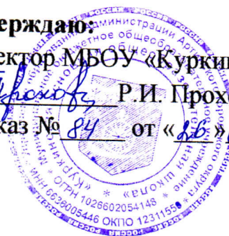
ГРАФИК ОРГАНИЗОВАННОГО ПИТАНИЯ ОБУЧАЮЩИХСЯ на 2020 - 2021 учебный год